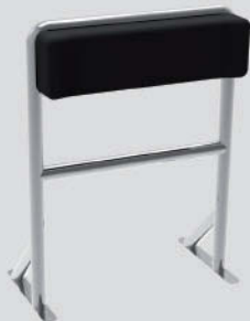
Respaldo Doble Cubierta Largo: 50cm - Ancho: 91cm - Alto: 120cm