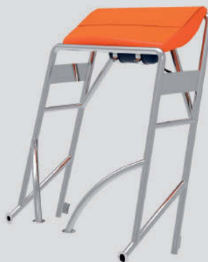
Arco Autoadrizado Largo: 131cm - Ancho: 106cm - Alto: 163cm