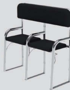
Asiento Abatible Doble Largo: 105cm - Ancho: 430cm - Alto: 104cm