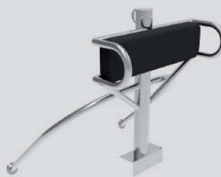
Respaldo Barra Esqui Largo: 146cm - Ancho: 142cm - Alto: 130cm