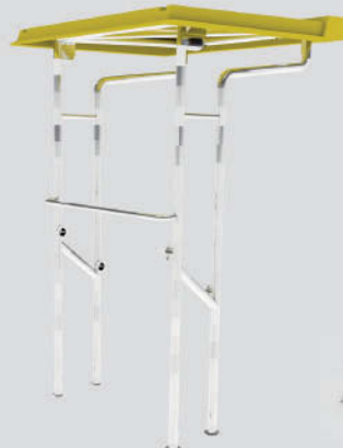
Tip-Top Fibra Largo: 145cm - Ancho: 121cm - Alto: 215cm