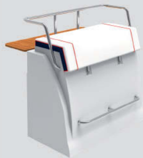
Cofre/respaldo S-700 F Largo: 54cm - Ancho: 110cm - Alto: 101cm