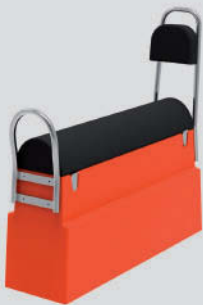
Asiento modular doble Largo: 112cm - Ancho: 32cm - Alto: 105cm