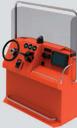
Consola S-800 PRO Largo: 55cm - Ancho: 143cm - Alto: 177cm