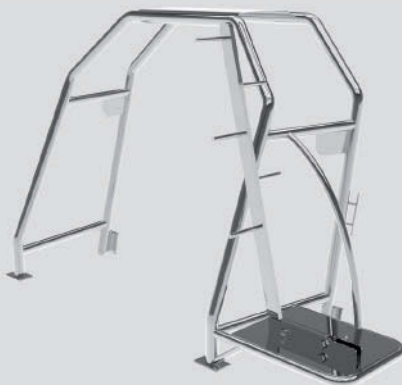
Arco de luces S-700 con escalera Largo: 108cm - Ancho: 241cm - Alto: 155cm