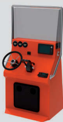
Consola S-700 PRO Largo: 76cm - Ancho: 100cm - Alto: 182cm