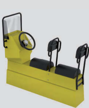
Jockey modular 2 plazas Largo: 159cm - Ancho: 50cm - Alto: 142cm