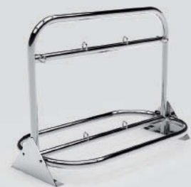
Botellero 6 botellas Largo: 103cm - Ancho: 58cm - Alto: 76cm