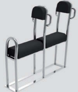
Asiento Modular 2 plazas Largo: 124cm - Ancho: 37cm - Alto: 113cm