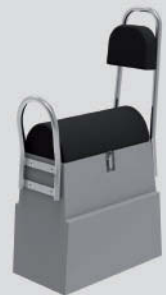
Asiento modular mono Largo: 62cm - Ancho: 32cm - Alto: 107cm